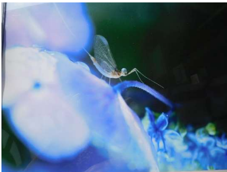
題名 : 魅せる 応募者 : 斎藤幸男 撮影場所 : 大田原市付近