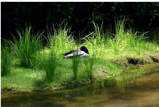
題名 : 陽のあたる場所 応募者 : 秋葉雅実 撮影場所 : 日光市戦場ヶ原付近