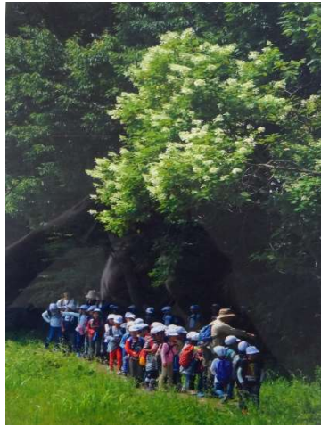
題名 : 校外自然観察 応募者 : 篠崎 勤 撮影場所 : 鶴田沼緑地