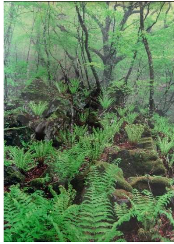
題名：香り漂う 応募者：山下一男 撮影場所：那須塩原市大沼付近