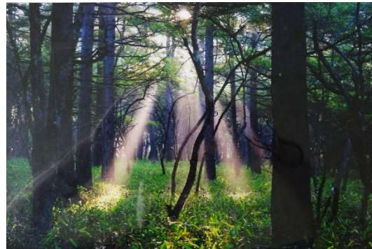
題名 : 舞い降りる天使の階段 応募者 : 梅田 明 撮影場所 : 奥日光光徳牧場付近