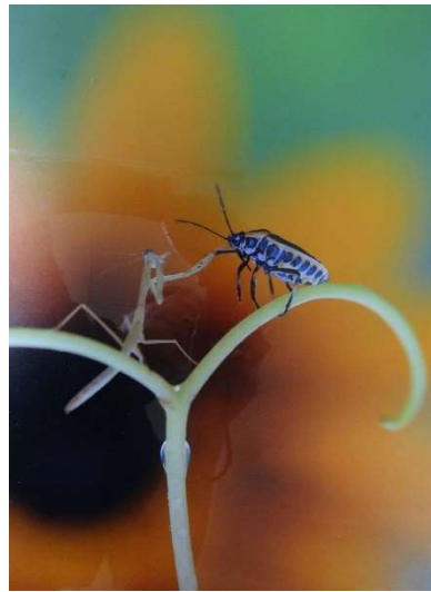
題名：仲直り 応募者：増川保紀 撮影場所：高根沢町付近