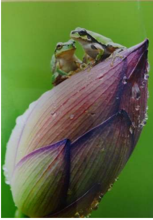
題名：里山の語らい 応募者：安納祐一 撮影場所：高根沢町付近