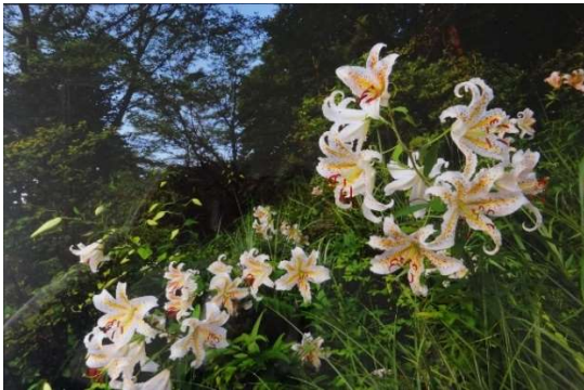
題名 : 夏の華やぎ 応募者 : 屋代 明 撮影場所 : 大田原市久野又付近